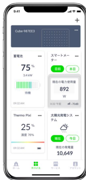
<電力・発電・蓄電画面>